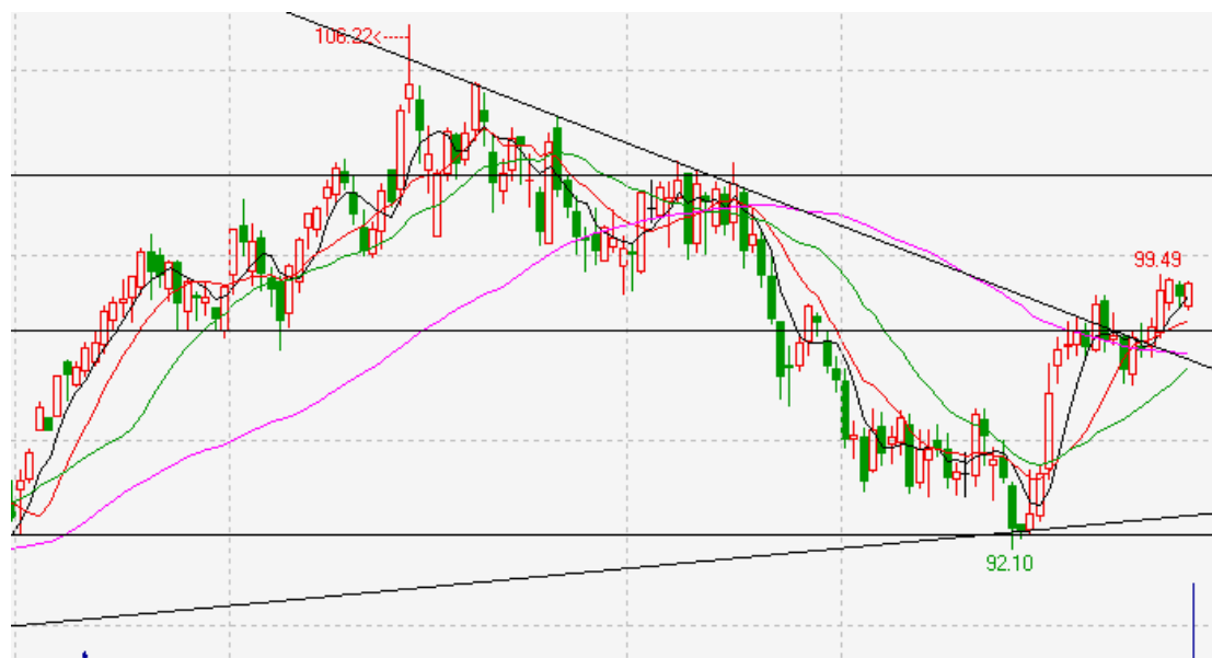
图 1: NYMEX（纽约商业交易所）WTI（西德克萨斯低硫轻质原油）原油期货 1402 合约走势图

截止 9.17 日, CFTC 公布的数据显示, 原油非商业多头持仓 2400 手, 较上周增加 298 手, 增幅为 14.18%; 原油非商业空头持仓为 3470 手, 较上周增加 1298 手。原油持仓净空 1070 手, 市场看空氛围较重。